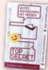
Webcam-Sticker kostenlos: bmfsfj.de/sticker